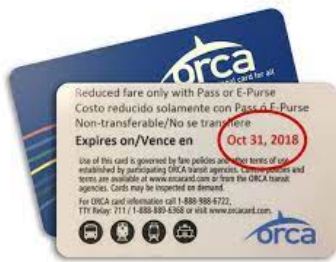
加州以外的其他公共交通機構卡樣本