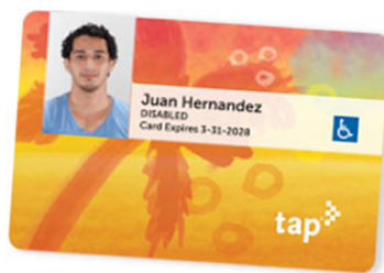
加州以內的其他公共交通機構卡樣本