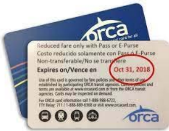
Modelo de tarjeta de otra agencia de transporte público fuera de California (CA)