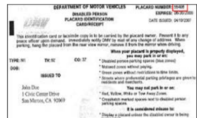
Modelo de recibo del DMV