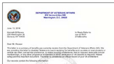
Modelo de carta del VA