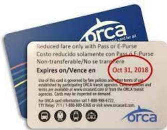
Sampol ng iba pang card ng Ahensyang Pang-transit sa labas ng CA