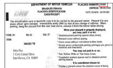
Sampol ng Resibo ng DMV