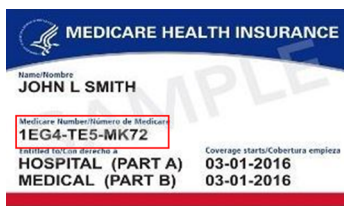
Sampol ng Medicare Card