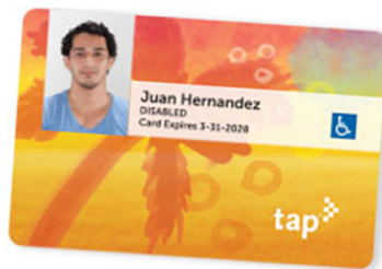
Sampol ng iba pang card ng Ahensyang Pang-transit sa loob ng CA