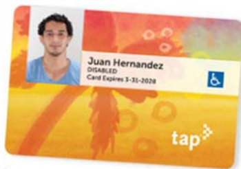
Sampol ng iba pang card ng Ahensyang Pang-transit sa loob ng CA