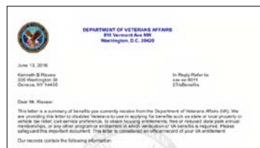
Sampol ng liham ng VA