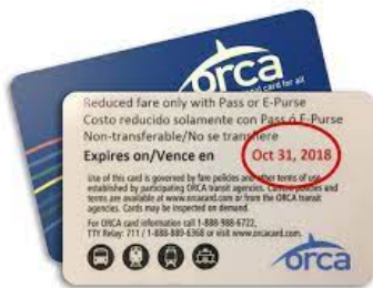
Sampol ng iba pang card ng Ahensyang Pang-transit sa labas ng CA